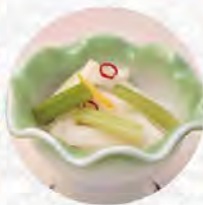
大根とセロリの浅漬け