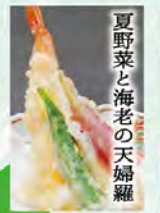
夏野菜と海老の天婦羅