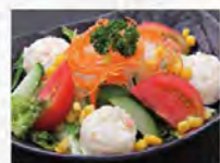
ファミリーサラダ