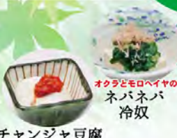
オクラとモロヘイヤの ネバネバ冷奴