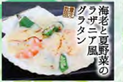
海老と夏野菜の グラタン