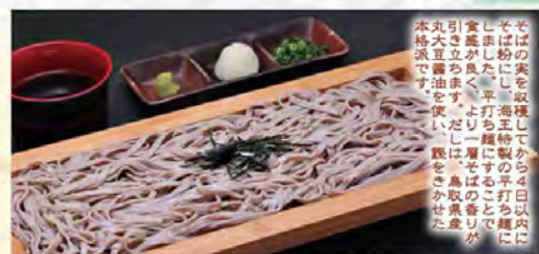
特製出雲ざるそば

そばの実を収穫してから4日以内にそば粉にし、海王特製の平打りそばに仕上げました。平打りそばにする事で食感が良く、より一層そばの香りが引き立ちます。ただし、鳥取県産丸豆を油を吸い、味をかきだす本流です。