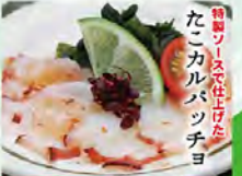
たこカルパッチョ