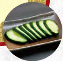
きゅうり一本漬け