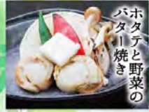
ホタテと野菜の バター焼き