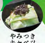
やみつき キャベツ