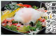
夏野菜とペリウシの シーサーサラダ