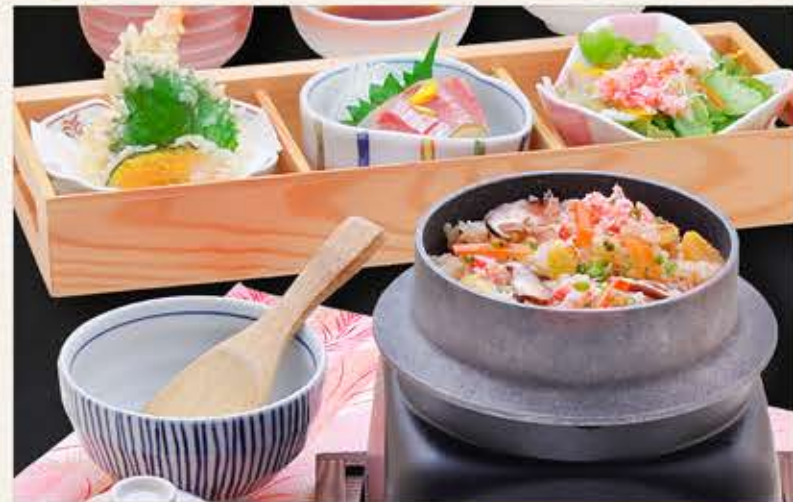
かに釜めしの 三ツ切定食 1,980円