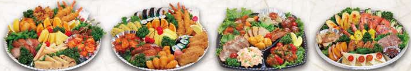
ビッグオードブル 寿司入りオードブル 中華オードブル 洋風オードブル