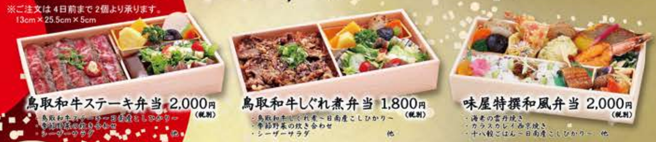
鳥取和牛ステーキ弁当 2,000円(税別) 鳥取和牛ぐれ煮弁当 1,800円(税別) 味屋特撰和風弁当 2,000円(税別)

鳥取県を代表する食材を余すところなく使った ◆ビジネスミーティングやセミナー等のご昼食に ◆大事なご商談や会議に ◆大切なお客様のおもてなしに その他、各種取り揃えております。