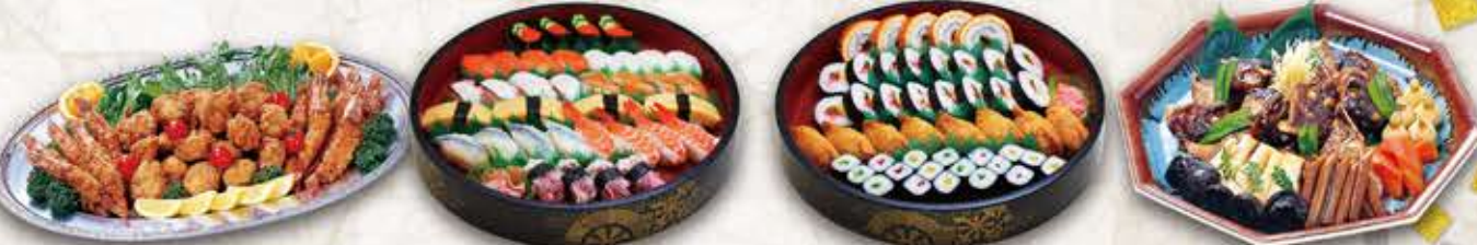
カラアゲ・海老フライセット にぎり寿司セット いなり寿司・巻き寿司セット 鯛のあら炊き