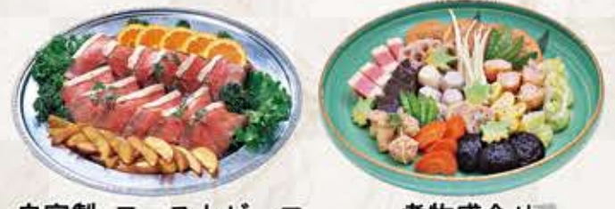
自家製 ローストビーフ 煮物盛合せ