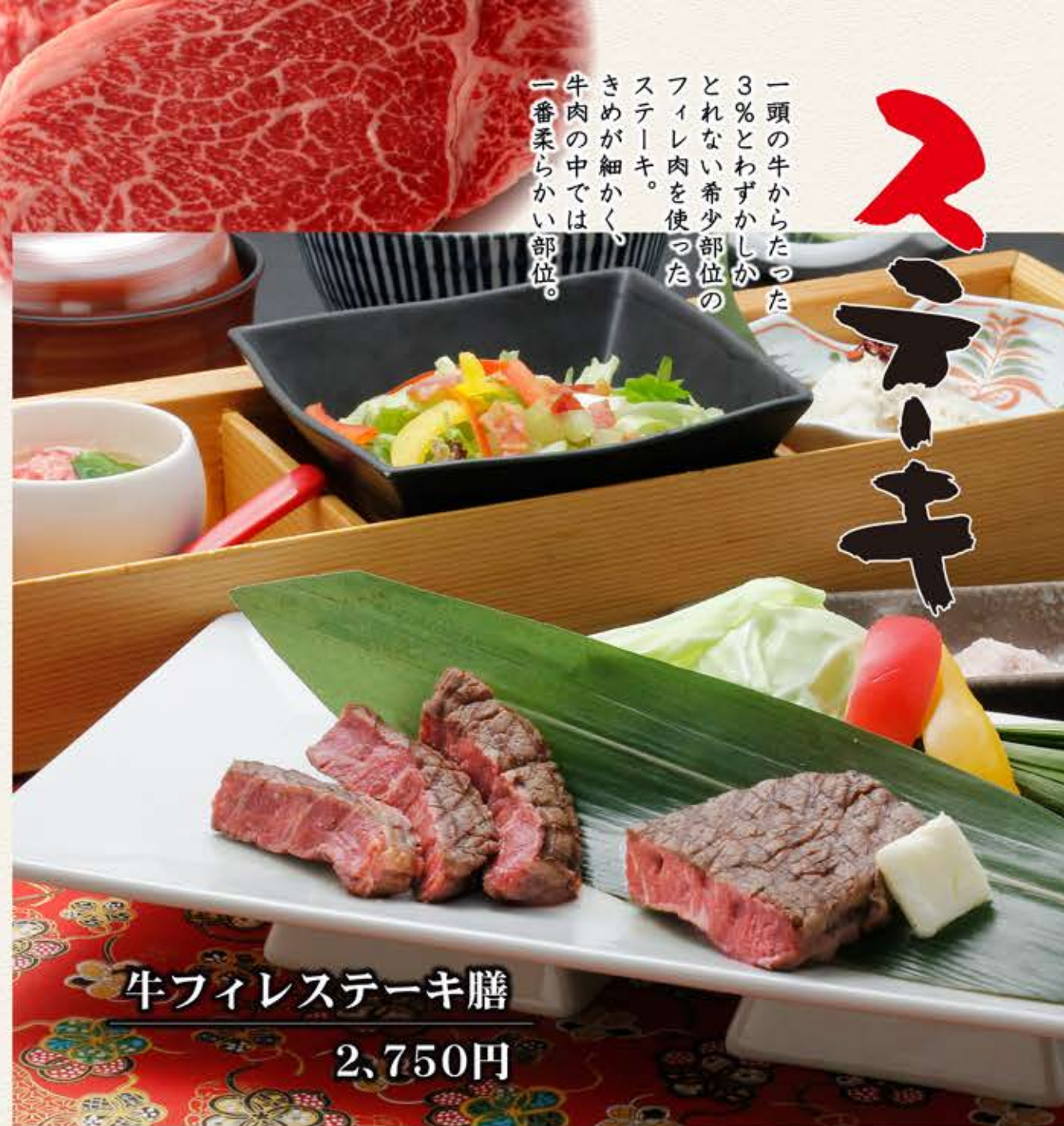
牛フィレステーキ膳