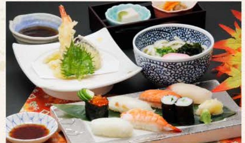
にぎり寿司と ミニうどんセット 1,980円