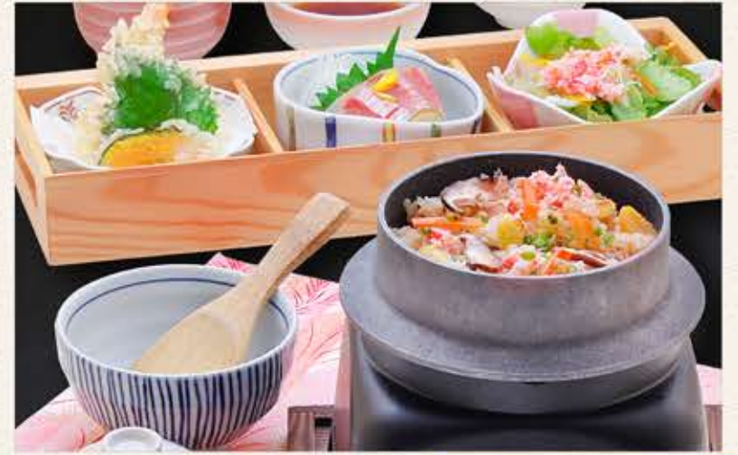
かに釜めしの 三ツ切定食 1,980円