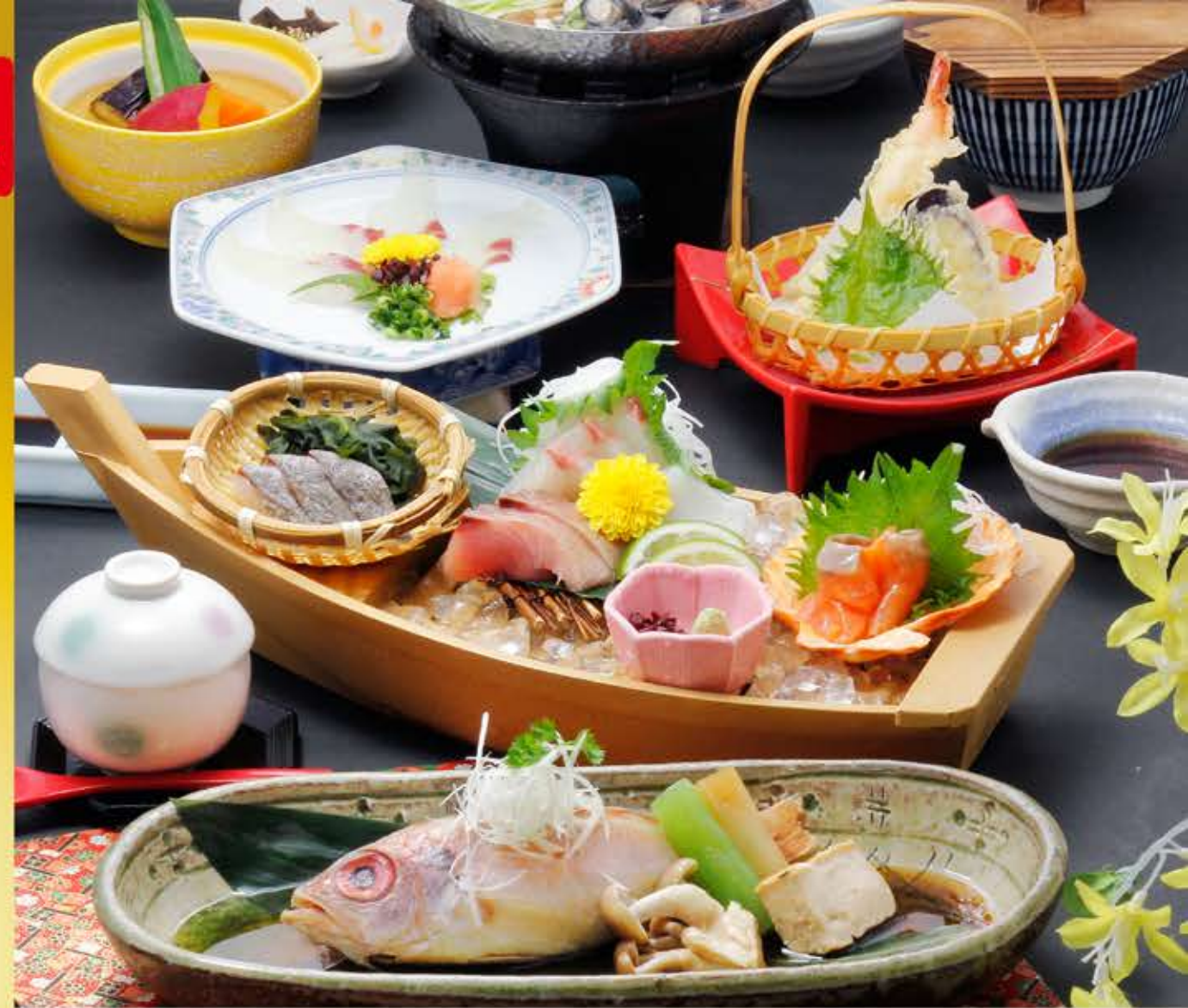
刺身天ぷら膳 (のどぐろ煮付け付き) 3,900円