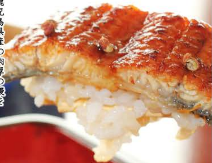
国産鰻のうな重膳

鹿児島県産の肉厚の鰻を一本一本丁寧に秘伝のタレで焼き上げ、皮はパリッと身はふっくらと仕上げました。香ばしい香りに包まれながら至福のひとときを。