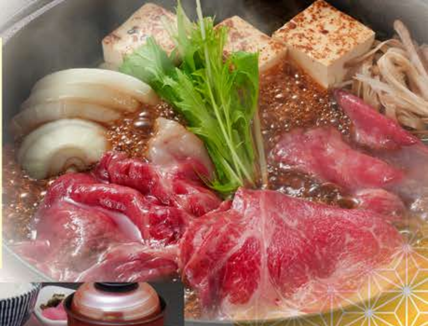
しゃぶしゃぶ膳 2,650円